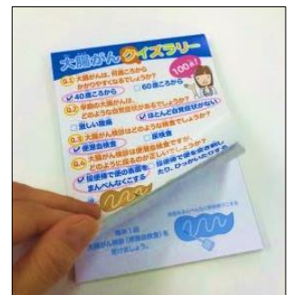
排便法のパラパラまんが付きメモ帳

【配布物】ポスター4枚。タイトルポスター2枚。クイズ解答用紙(裏面アンケート付)、啓発小冊子、ノベルティ(メモ帳)は各100部単位×ご希望口数。これらをセットにしてお送りします。