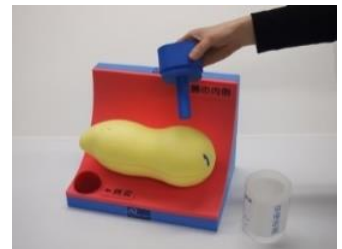
「大腸がん検診べん君」 採便方法を説明する模型の(有料レンタル)