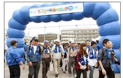
「Tokyo健康ウォーク2018」開催