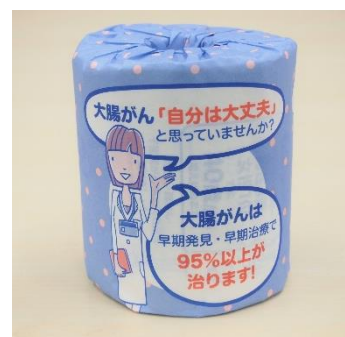
トイレで大腸がん検診を呼びかけるトイレトーパー(有料)