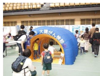
「大腸トンネル探検隊」 「大腸がんクイズラリー」と一緒に使用し、来場者を呼び込む資材の(有料レンタル)