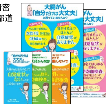
大腸がん検診について分かりやすくまとめた小冊子・ポスター(無償)