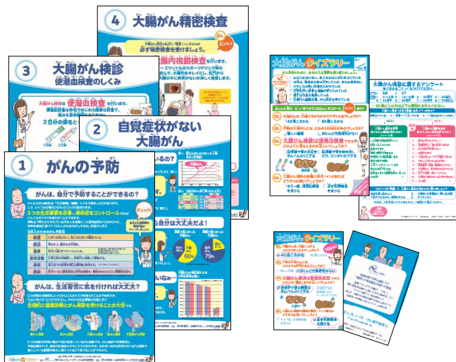
楽しみながら大腸がんについて学べる「大腸がんクイズラリー」(無償)

「大腸がんクイズラリー」資材の他にも、大腸がん検診や精密検査を分かりやすく解説した小冊子(3種)やポスター等を都道府県や市区町村のがん対策担当へ無償提供しています。