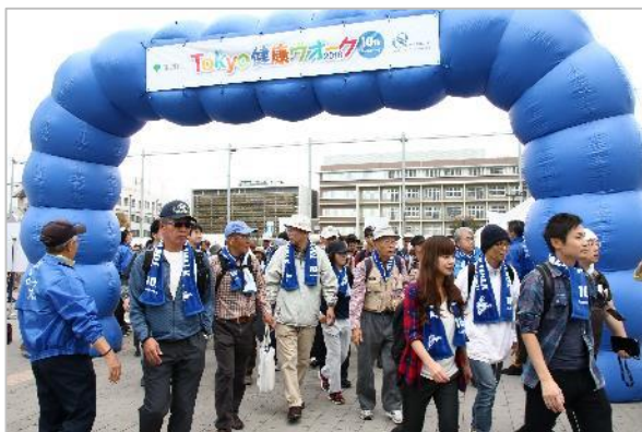
バルーンアーチをくぐってウォーキングスタート