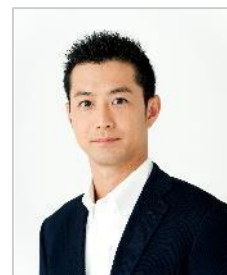
北京五輪 競泳メダリスト/ スポーツキャスター 宮下純一さん

今年で11回目を数える本イベントは、2009年より毎年都内の各地域で開催しており、今回は江東区にて行います。休日は家族連れで賑わう水と緑が豊かな都立木場公園をスタートし、水辺の爽やかな風を感じながら臨海部を歩き、豊洲ぐるり公園を折り返して、下町風情の残る門前仲町～清澄白河へと向かうコースです。江東区周辺をめぐる12km・6kmのコースを歩き、大腸がんに関するクイズラリーに挑戦していただきます。