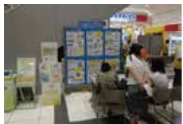
クイズをじっくり解く参加者 (奈良県)

滋賀県 [大津市、近江八幡市] 京都府 [福知山市] 大阪府 [大阪市都島区、大阪市港区、大阪市住吉区、大阪市中央区、枚方市、泉佐野市、富田林市、河内長野市] 兵庫県 [西宮市、加西市、たつの市] 奈良県 [奈良県、王寺町] 和歌山県 [有田市、田辺市] 鳥取県 [岩美町、八頭町] 島根県 [浜田市] 岡山県 [岡山市、笠岡市、備前市、瀬戸内市、早島町] 広島県 [呉市、竹原市、廿日市市、海田町] 山口県 [山口市、岩国市]