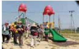
家族でウォーキングしながらクイズラリー (宮城県山元町)

茨城県 [下妻市、常総市、常陸太田市、取手市] 栃木県 [栃木県、野木町] 群馬県 [前橋市、渋川市] 埼玉県 [さいたま市岩槻区、秩父市、戸田市、毛呂山町] 千葉県 [銚子市、浦安市、白井市] 東京都 [港区] 神奈川県 [横浜市保土ヶ谷区、寒川町] 新潟県 [長岡市、柏崎市、新発田市] 富山県 [高岡市、魚津市、入善町]