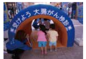
大腸トンネル探検隊をくぐって病変くんをさがそう！

青い大腸トンネルは来場者の目を引き、特に子どもたちは楽しそうにくぐって「病変くん」マークを探し、その姿に誘われるように他の子どもたちもトンネルに来てくれました。出口にいるスタッフに「病変くん」の数を伝え、「正解！」と言われるととても嬉しそうなお表情をしていた子どもたちでした。