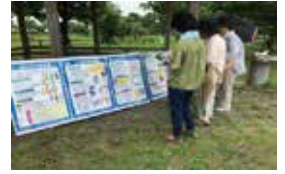
健康づくりをかねてウォーキング & クイズラリー (三重県東員町)

道北勤医協旭川医院、リレーフォーライフ広島実行委員会、一般財団法人奈良県健康づくり財団、社会医療法人母恋日鋼記念病院、一般財団法人京都工場保健会、国保野上厚生総合病院、道北勤医協旭川北医院、社会医療法人蘇西厚生会松波総合病院、オリンパスメディカルサイエンス販売株式会社、会津オリンパス株式会社