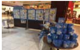
見やすく参加しやすい配置の工夫 (群馬県前橋市)

石川県 [加賀市、津幡町] 福井県 [福井県、坂井市、永平寺町、越前町] 山梨県 [山梨県、身延町、昭和町] 長野県 [松本市、小諸市、大町市、佐久市] 岐阜県 [大垣市、多治見市、土岐市、海津市、大野町、川辺町、白川町] 愛知県 [愛知県、安城市、蒲郡市、新城市] 三重県 [尾鷲市、亀山市、鳥羽市、御浜町]