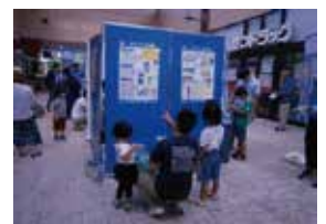
親子で仲良くクイズラリーに挑戦

「じかくしょうじょう、ってどういう意味？」「お腹や頭が痛い、とか自分で具合が悪いなあ、って感じることだよ」など、クイズラリーの内容から、親子の間で会話が生じる様子が見られました。