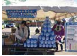
目を引く大腸がん撲滅トイレトペーパーのディスプレイ (北海道寿都群黒松内町)

北海道 [北海道、釧路市、黒松内町、日高町、厚岸町] 青森県 [階上町] 岩手県 [矢巾町] 宮城県 [利府町] 山形県 [山形県、大江町] 福島県 [福島県、矢祭町]